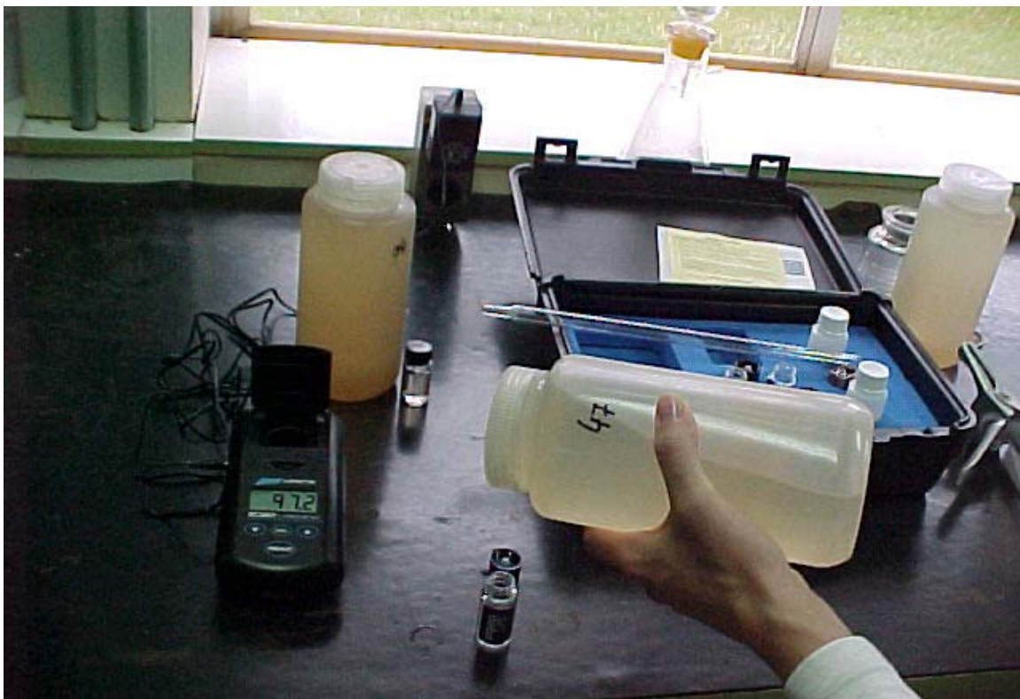
Figura 2. Determinação de turbidez no laboratório.