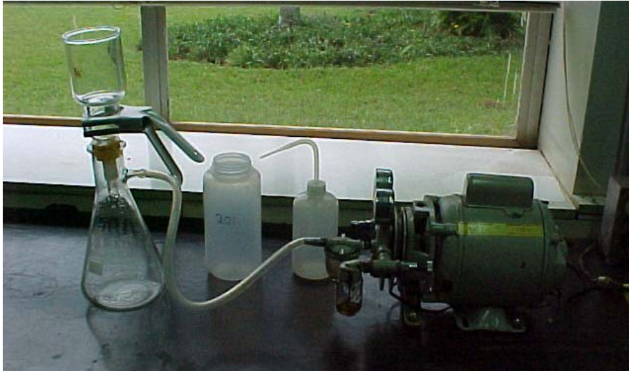
Figura 1. Sistema de filtragem com bomba e pisceta.